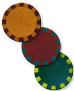
3 tuiles Podium

didacto.com Des jeux et activités de qualité pour tous les âges.