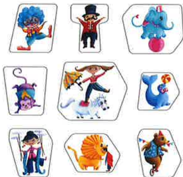
9 blocs Personnage en bois